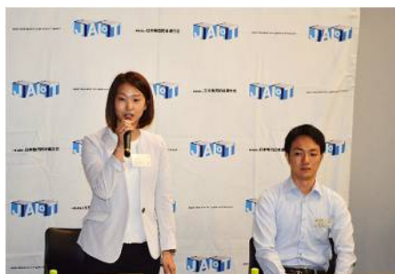
物流いいとこみつけ隊によるメッセージ