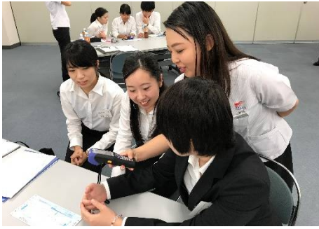
セイノースーパーエクスプレス(株)