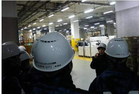
(株)ニチレイロジグループ本社