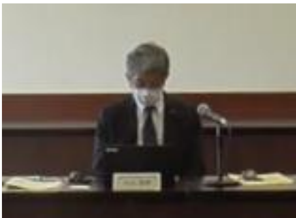
外山委員長による議事進行